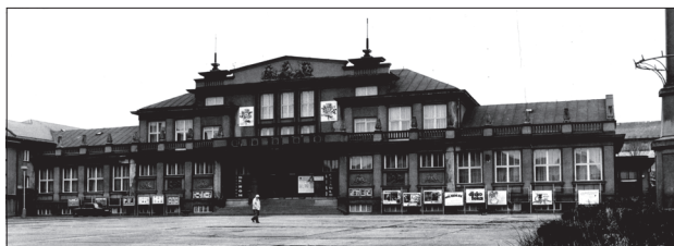
276 / Kulturní dům, 1989.